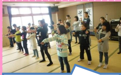
児童室で大人気だった「恋ダンス」をみんなで踊ったよ！

1月21日、大浜会のみなさんとの交流会「風の子会」がありました。たくさん遊んでもらった後はカレーライスをごちそうになりました。また、この日のために一生懸命練習したダンスをお披露目。あたたかい拍手をいただき、とっても嬉しそうなお子様もたくさんでした。