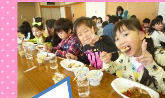
カレーがとってもおいしくて...おかわりしちゃったよ～★