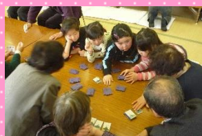
たくさんあそんでくれて、ありがとうございました(*^▽^*)