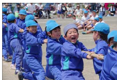
<力が入った綱引き>