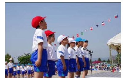
<1年生「ちかいの言葉」>