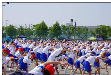
<そろってラジオ体操>