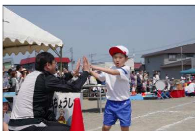
<校長先生にハイタッチ>