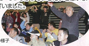
「クリスマス大会」の様子

昨年も助成金により充実した交流会を開くことができました。参加者の方からは「とても良かった、ありがとう。次回も教えてください。」と言われ大成功でした。まだまだ障がい者に対する理解が少ない中、助成金に感謝し「ありがとう」でつながっていきたく思います。ありがとうございました。