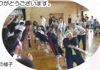
奥内地区社協 「綱引き大会」の様子

それぞれの地区で地域独自の活動を展開しております。独自事業により、財源確保が難しくなっている事業を継続して行うことができ、とても充実しております。大変ありがとうございます。