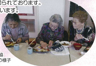
県庁南地区社協 「にこにこ会」の様子

日頃社会との交流が少ない70歳以上のひとり暮らし高齢者を対象として、仲間づくり、生きがいづくりを行い、地域でいつまでもいきいきと暮らせるよう相互の親睦と交流が図られております。ありがとうございます。