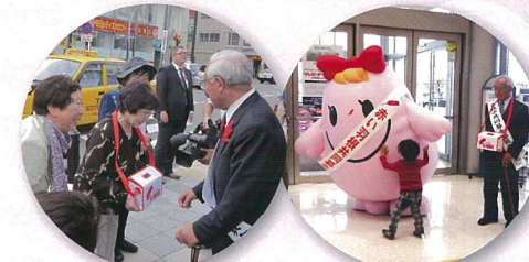
新町周辺で街頭募金活動

赤い羽根共同募金は、昭和22年から始まり、今年で第69回目を迎える歴史ある活動です。共同募金の目的は、「地域福祉の推進」です。補足しますと、自分たちの住む地域の行政制度・サービスでは支えきれない地域課題を解決するための活動財源となっております。その為、課題解決にはどのくらいの財源が必要であるかを募金活動が始まる前に使い道を定める「計画募金」で行われます。赤い羽根共同募金を通じて地域の人たちが「じぶんの町をよりよくするために」というあたたかい気持ちを持つことが必要となります。みなさまのご支援・ご協力を宜しくお願い致します。