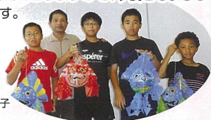
親子の研修旅行 「金魚ねぶた作り」の様子

私どもの会に助成金をいただきましてありがとうございます。会員一同感謝しております。雇用の関係、年金の関係など、社会情勢は母子寡婦にとって、年々厳しい状況にありますが、いただいた助成金を活動資金とし、みんなで力を合わせて助け合い、更なる力をつけて参りたいと考えておりますので、今後ともよろしくお願いたします。