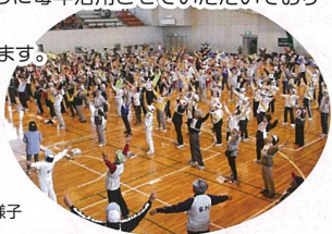
「スポーツ大会」の様子

単位クラブの減少により、当連合会では年々自主財源の確保が厳しい状況で、貴会からの助成金は大変ありがたく、高齢者の生きがいづくり、見守り活動、地域コミュニティづくりに毎年活用させていただいております。ありがとうございます。